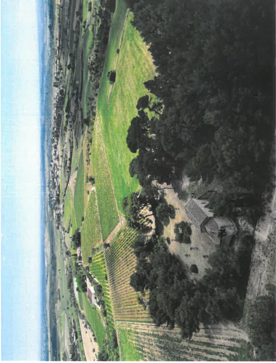
La chapelle de Montalaurou à Pailhès